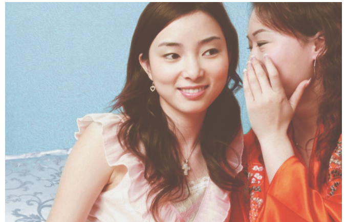
Je mehr man übereinander weiß, desto einfacher ist es, sich zu vertrauen.

Das SCHUFA-System basiert auf Gegenseitigkeit: Unsere rund 4.500 Vertragspartnerunternehmen geben Informationen zu Kreditaktivitäten ihrer Kunden, zu Verträgen mit Zahlungszielen oder Ratenzahlungen, aber auch zu etwaigen Zahlungsausfällen an uns weiter. Und sie fragen Informationen in Form einer SCHUFA-Auskunft an, wenn sie z.B. darauf vertrauen müssen, dass der Kunde nach Erhalt der Leistung oder Ware bezahlt.