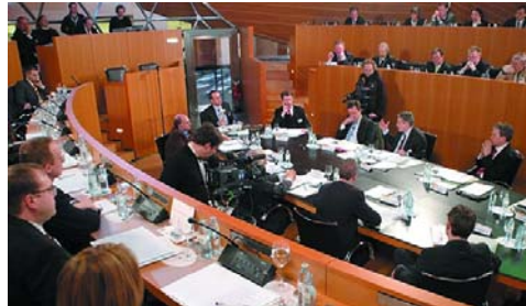
Blick ins Plenum