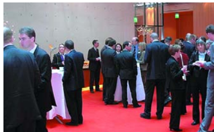
Diskussion im Foyer